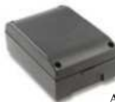
Armoire de commande CC242ESSB disponible séparément